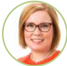
LAURA RÄTY Helsinki LL, sosiaali- ja terveys- ministeri Kokoomus

Minulle tärkeitä teemoja ovat maailman parhaat palvelut, valinnanvapaus ja yksinäisyyden torjunta.