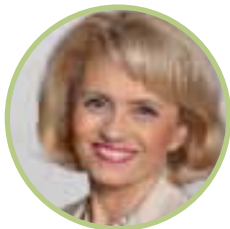
PÄIVI RÄSÄNEN Riihimäki LL, kansanedustaja sisäministeri Kristillisdemokraatit

KD:n vaalislogan on rohkeus rakentaa tulevaisuutta. Haluan jatkaa työtä erityisesti perheiden hyvinvoinnin puolesta, terveydenhuollon tason parantamiseksi, ihmisarvon ja -oikeuksien toteutumisen puolesta sekä työn ja yrittämisen edistämiseksi. Tulen puolustamaan perheiden valinnanvapautta myös tulevilla vaalikaudella. Toimivat terveystalvet ovat osa arjen turvallisuutta. Perusterveydenhuolto on vahvistettava ja painopistettä siirrettävä ennalta ehkäiseviin palveluihin. Sote-uudistus tulee viedä läpi niin, että lähipalvelut turvataan. Syrjäytymisen ennaltaehkäisy vaati lisäpanostusta.